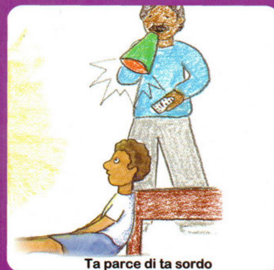
Ta parce di ta sordo